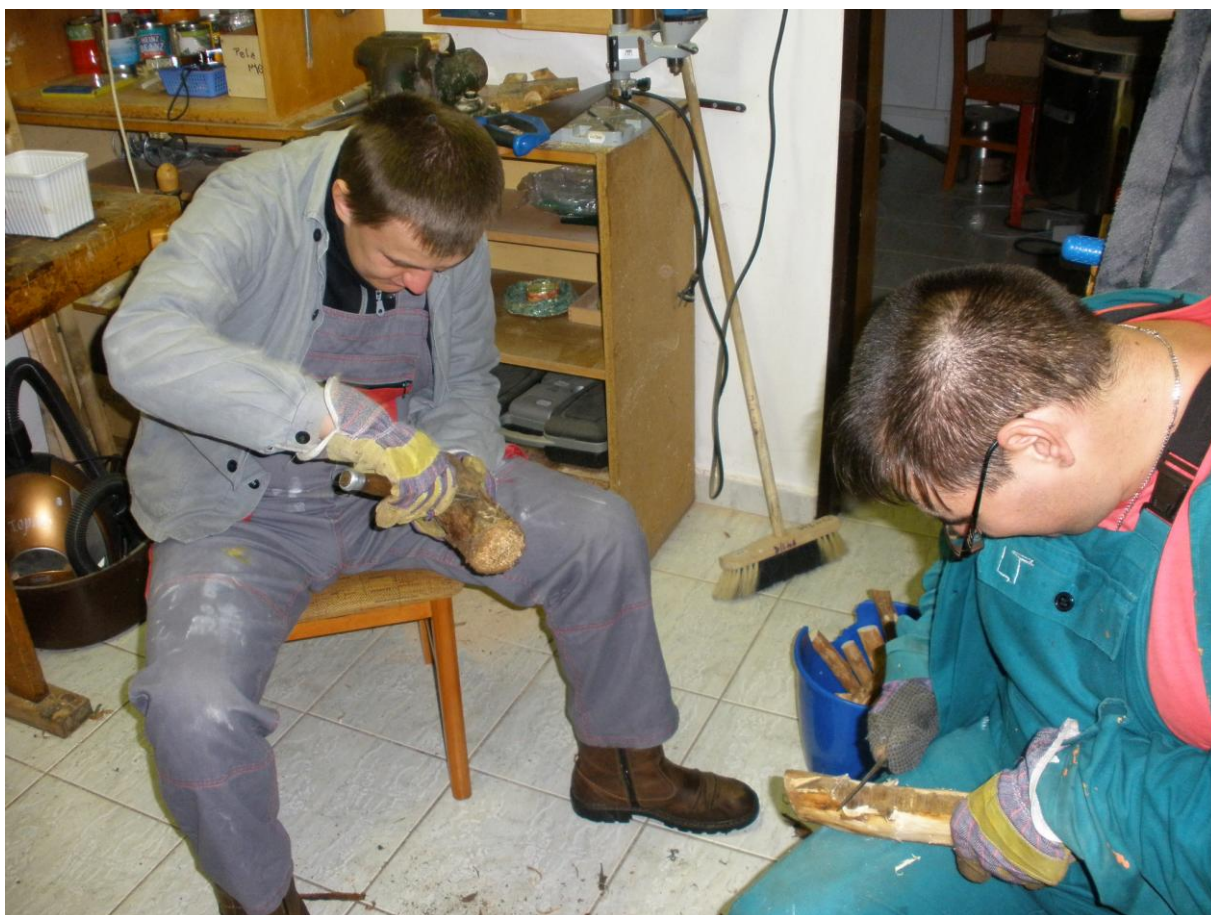
práce v dílně

Cílem práce organizace je, aby tito lidé mohli kvalitně a samostatně, popř. s co nejmenší mírou podpory, uspokojovat své osobní potřeby a zájmy uvnitř běžné společnosti. Služby „LADY“ jsou orientovány na rozvoj individuálních znalostí a dovedností uživatelů, posilování jejich sebedůvěry, sebevědomí a vlastního rozhodování.