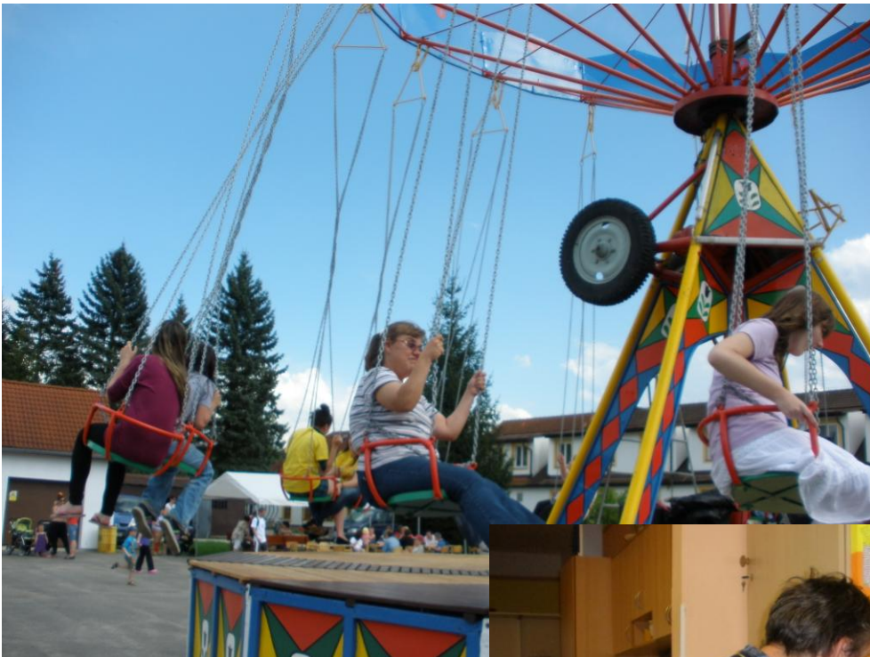
pout' v Domově Pístitina