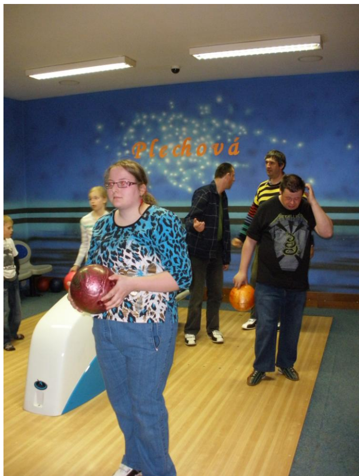
bowling v Pacově