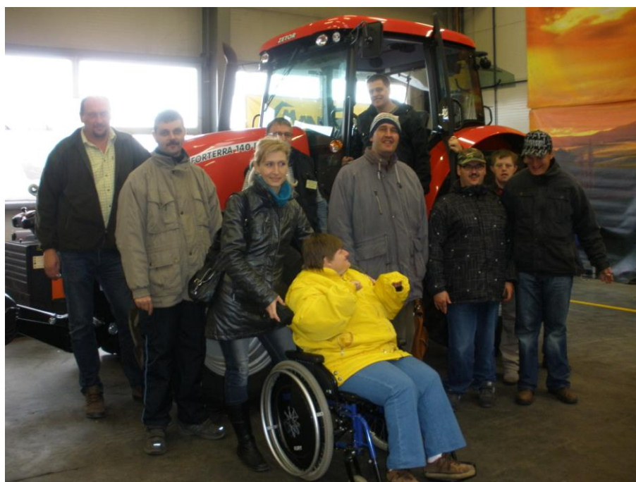
návštěva v MANATECHU CZ s.r.o. v Jiřicích