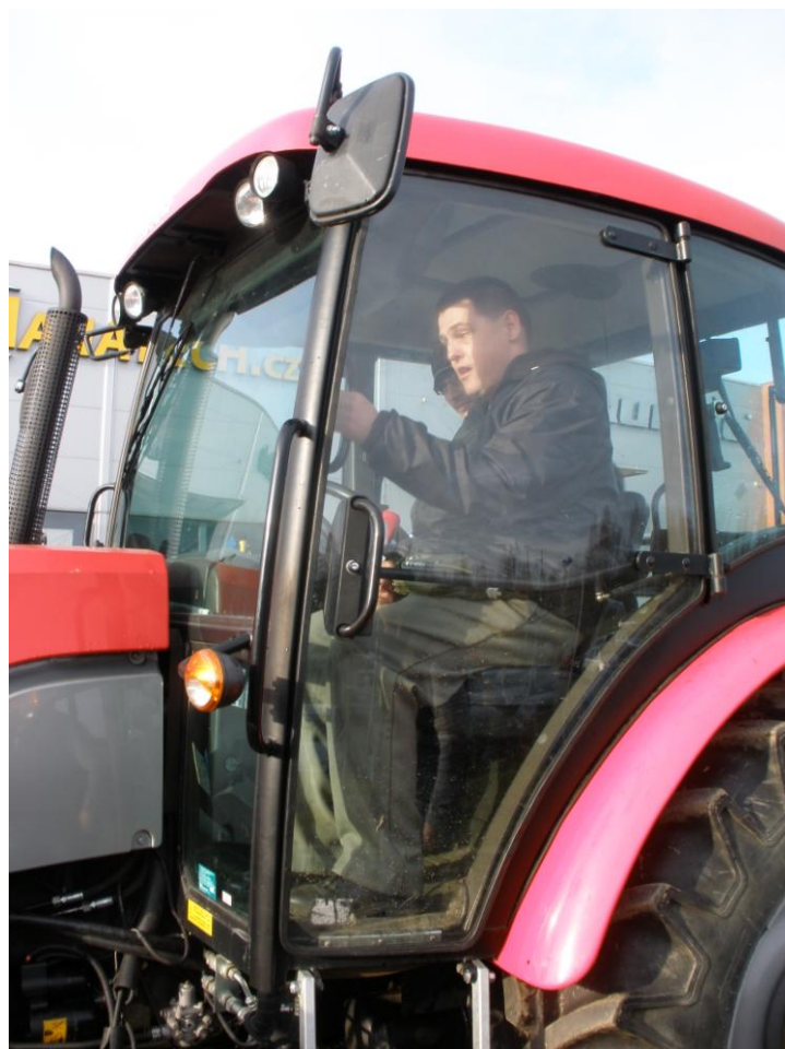
MANATECH CZ s.r.o. Jiřice

Grafická úprava: Petra Kotková administrativní pracovnice