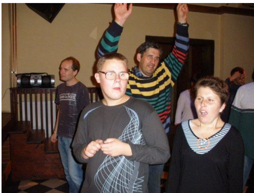
diskotéka v Pelhřimově

Faktem totiž je, že většina našich klientů za těch 10 let samozřejmě zestárla a jako každý jiný člověk nerad mění své zvyky, mají rádi svůj klid a hlídají si vlastní prostor možná víc než dřív.