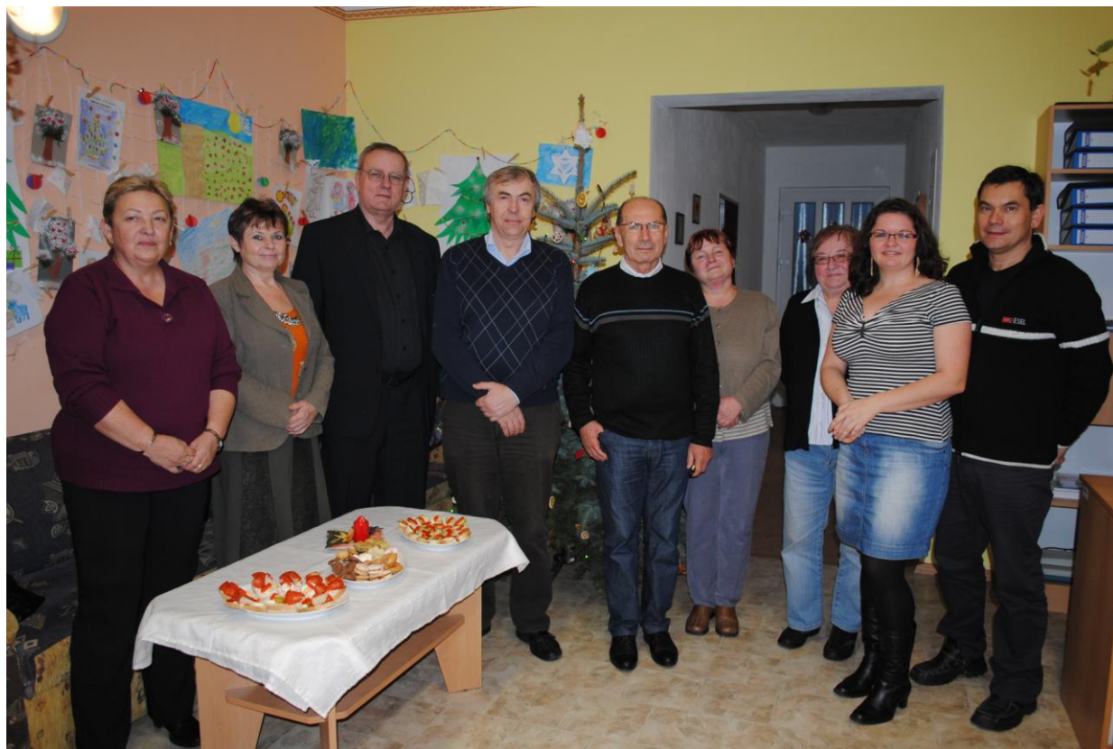
naši sponzoři na vánoční besídce