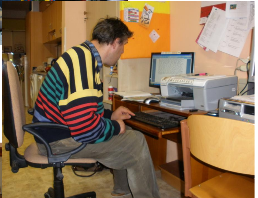
práce na počítači