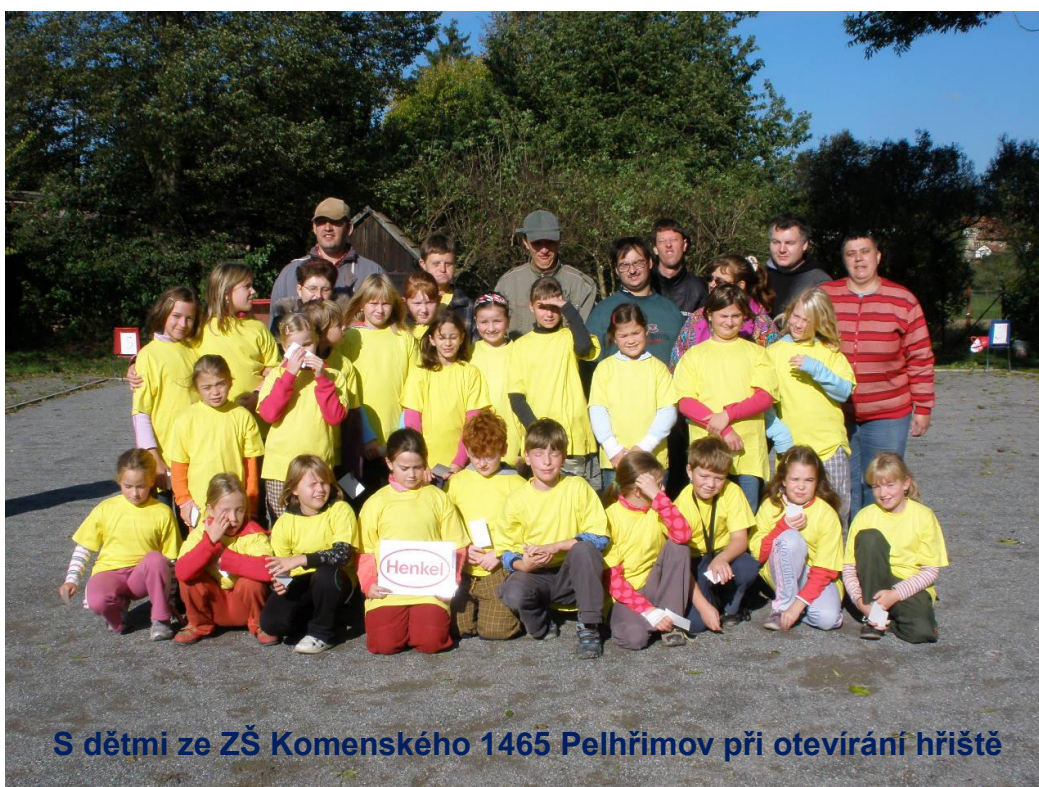
S dětmi ze ZŠ Komenského 1465 Pelhřimov při otevírání hřiště